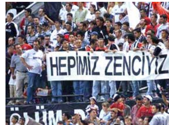
“Svi smo mi crni!”

sude nemaju osnove dokazuje akcija “skupljanja čepova kao pomoć ljudima sa ometanjem”.