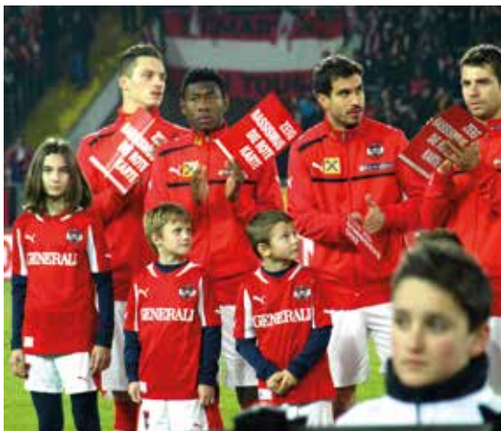
Austrijska reprezentacija na utakmici protiv Obale Bjelokosti (Côte d'Ivoire), 15. nov. 2012. u Linzu

Ideja je uvijek bila da je naš posao završen, znači da možemo da se ukinemo, kad stvorimo svijet i fudbal u kojem diskriminacija i rasizam više ne postoje. Meni bi bilo drago da uspijemo stvoriti svijet u kojem boja kože, spolnost, starost, porijeklo itd. ne igraju više ulogu. Nadam se da će jednoga dana biti moguće da stojimo iza našeg identiteta a da ne postanemo žrtva diskriminacije.