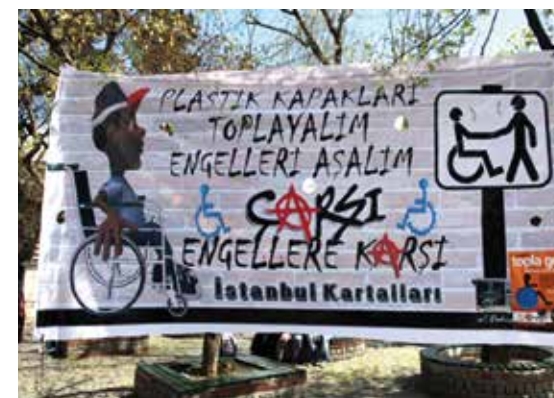
„Skupimo čepove za ljude sa tjelesnim i mentalnim oštećenjem i pomozimo im.“

Tokom akcije je skupljeno 2,5 tona plastičnih čepova za recikliranje. Do sada se tim novcima finansiralo 2.000 invalidskih kolica.